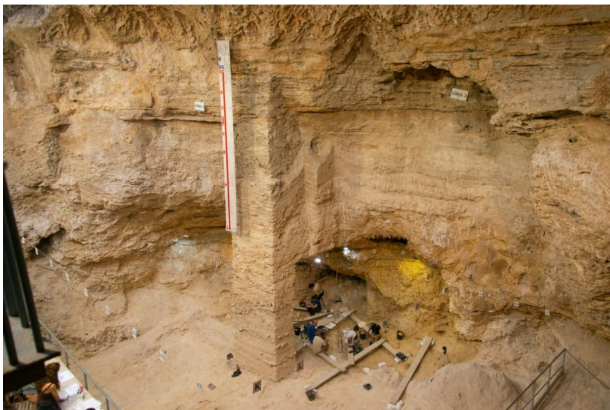
Imagen general del yacimiento del Abric Romaní de Capellades durante los trabajos de excavación de este verano.