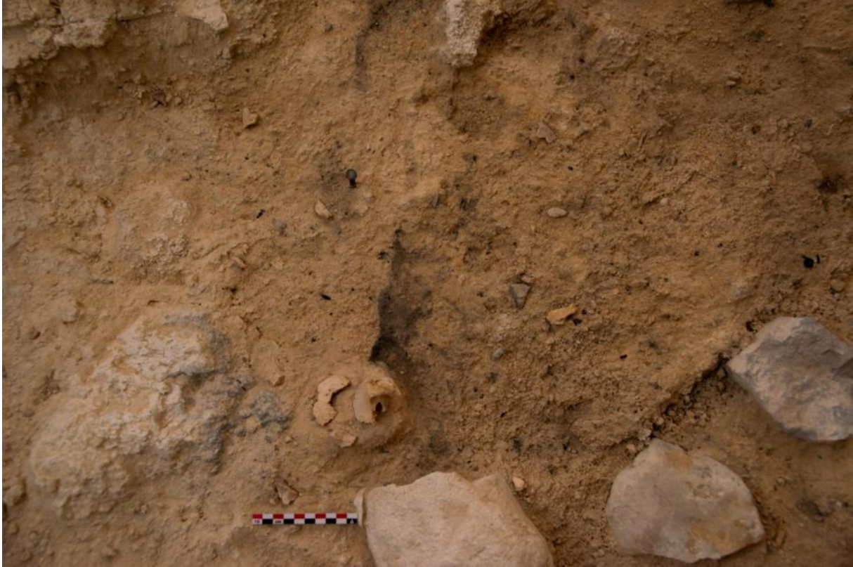
Restos humanos del Neandertal del Abric Romaní en el lugar dónde fue encontrado el 19 de agosto pasado.

Uno de los objetivos de esta campaña era terminar con la excavación en extensión del nivel R, un nivel que corresponde a un campamento neandertal de 60.000 años, especializado en la caza de ciervos y, de este modo, empezar un nuevo nivel, el nivel S. Lo que nadie esperaba y mucho menos el equipo investigador responsable era la sorpresa que el yacimiento les estaba reservando.