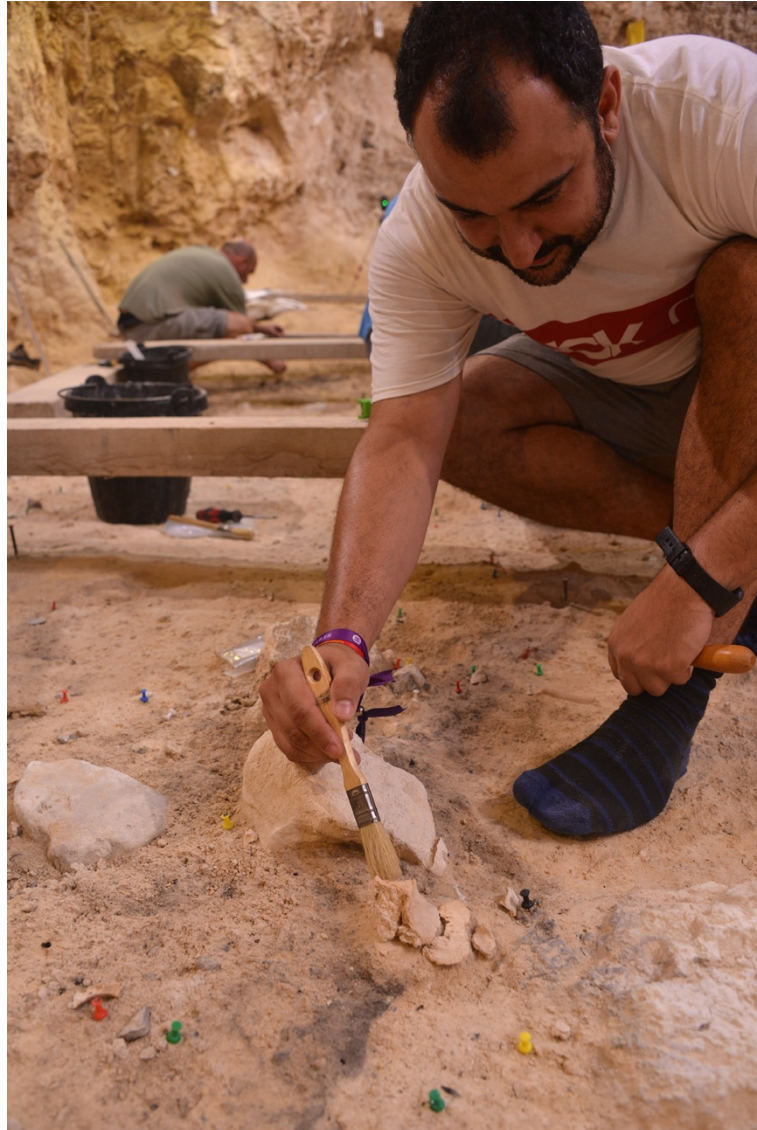
Excavación de los restos del Neandertal del Abric Romaní.