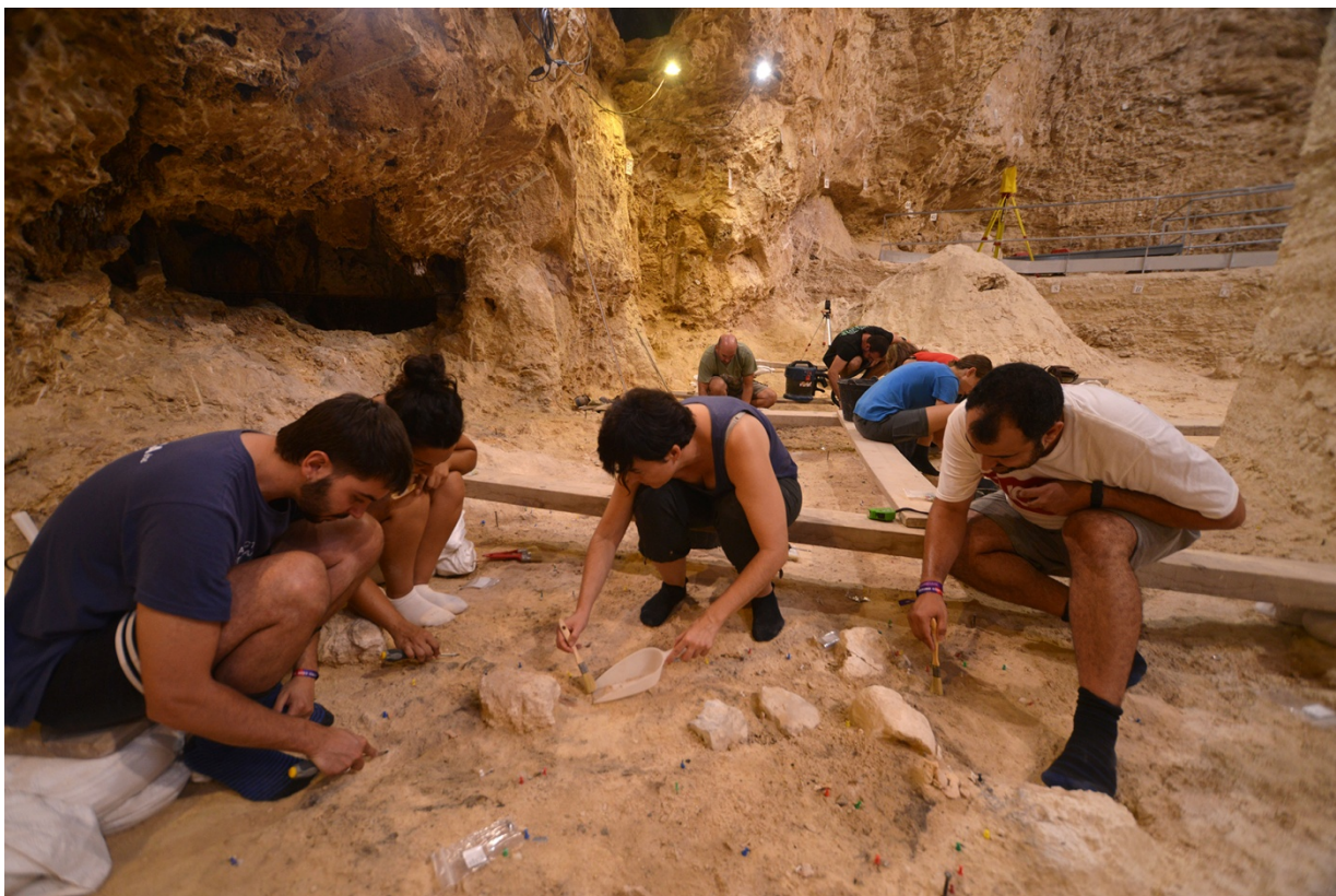
Excavación en la zona donde ha aparecido el Neandertal de l'Abric Romaní.

Finalmente estos días la técnica restauradora del IPHES-CERCA Irene Cazalla ha llevado a cabo un minucioso trabajo de restauración y conservación de los restos humanos para que puedan ser manipulados por su posterior estudio.